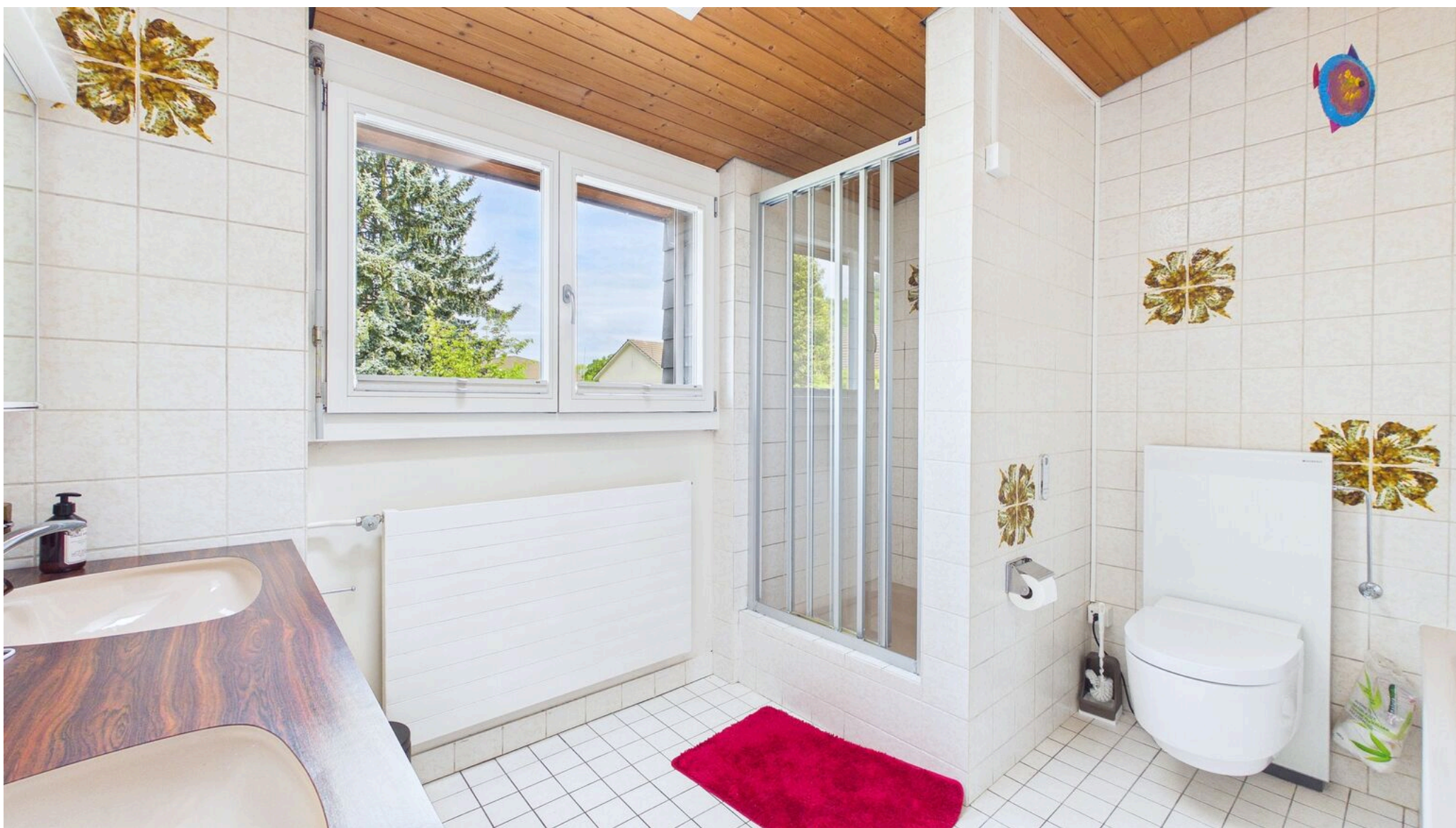
Bad mit Dusche/Badwanne