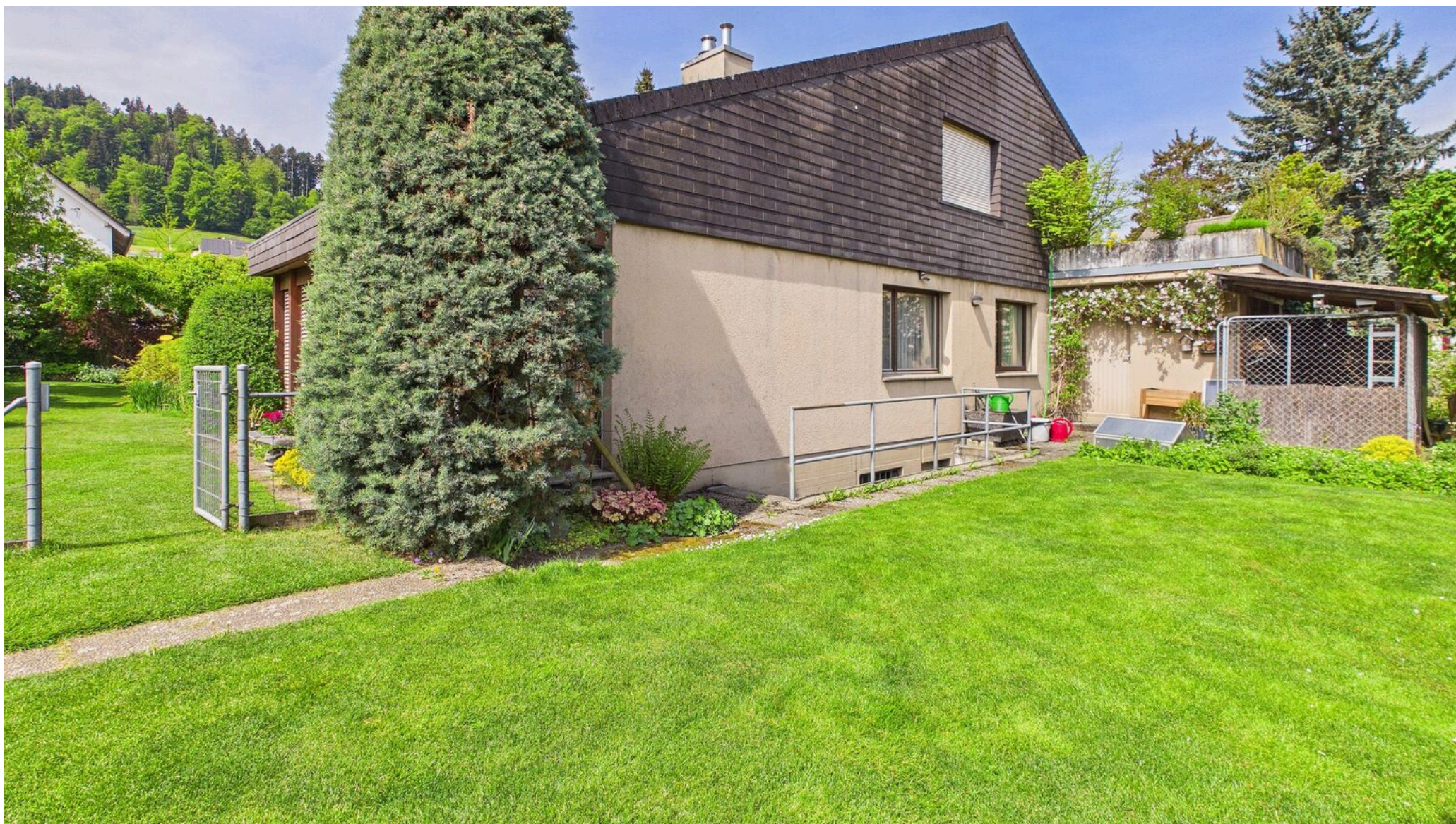
Garten und Aussenzugang UG