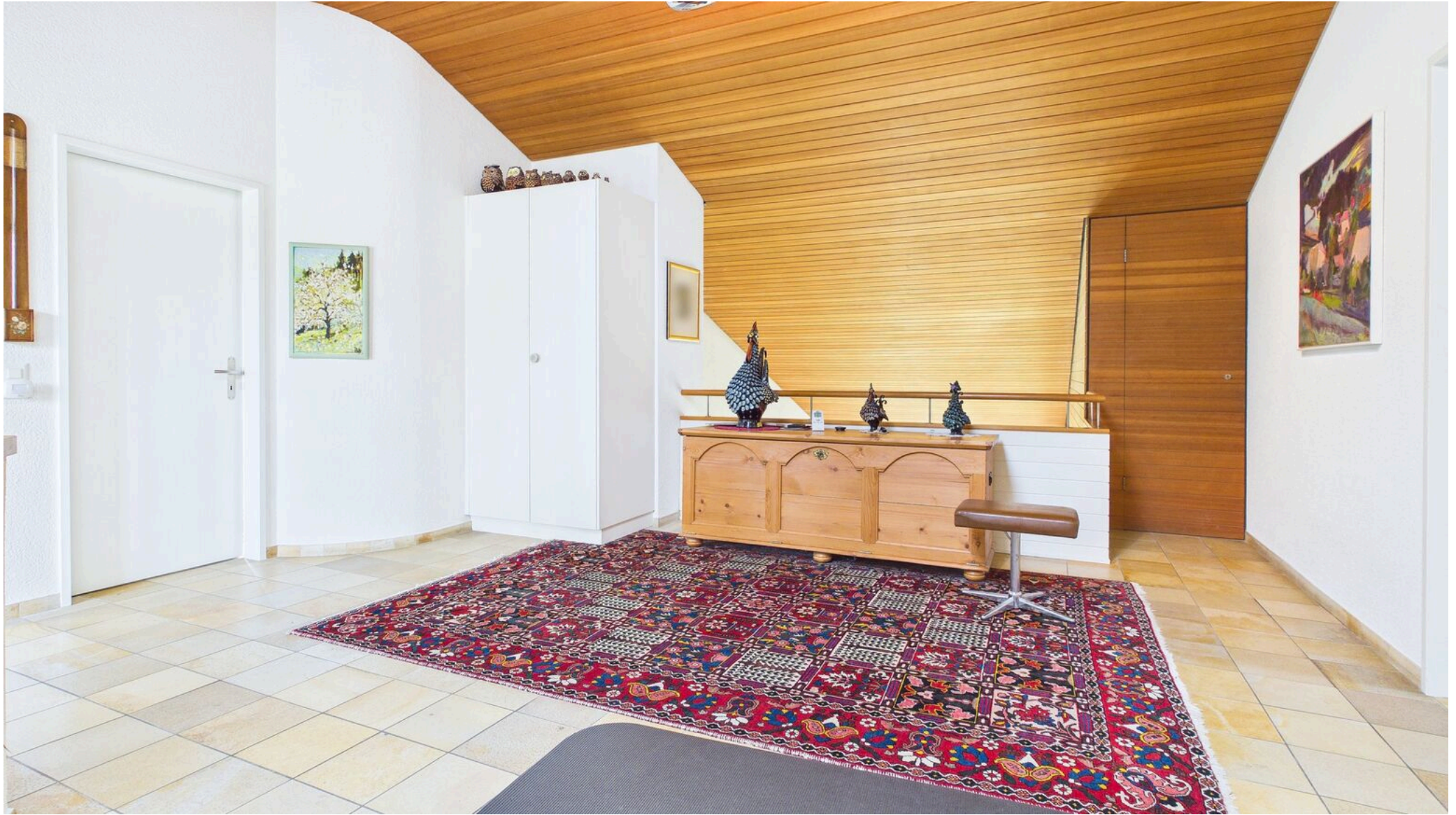
Vorplatz Galerie OG