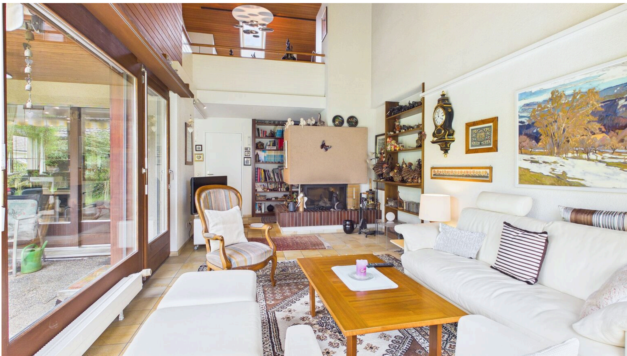
Wohnen / Galerie