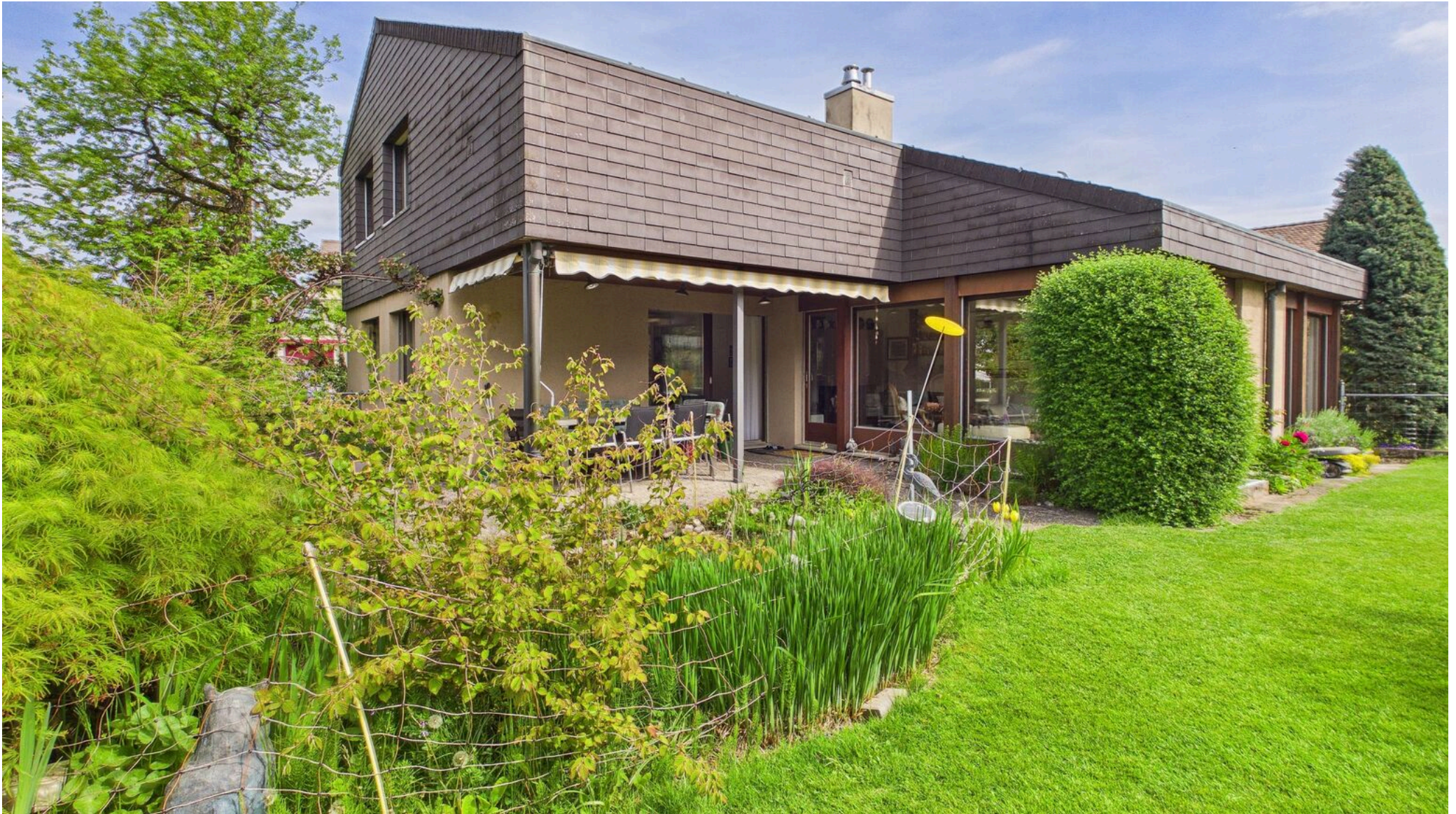
Gedeckter Gartensitzplatz am Teich