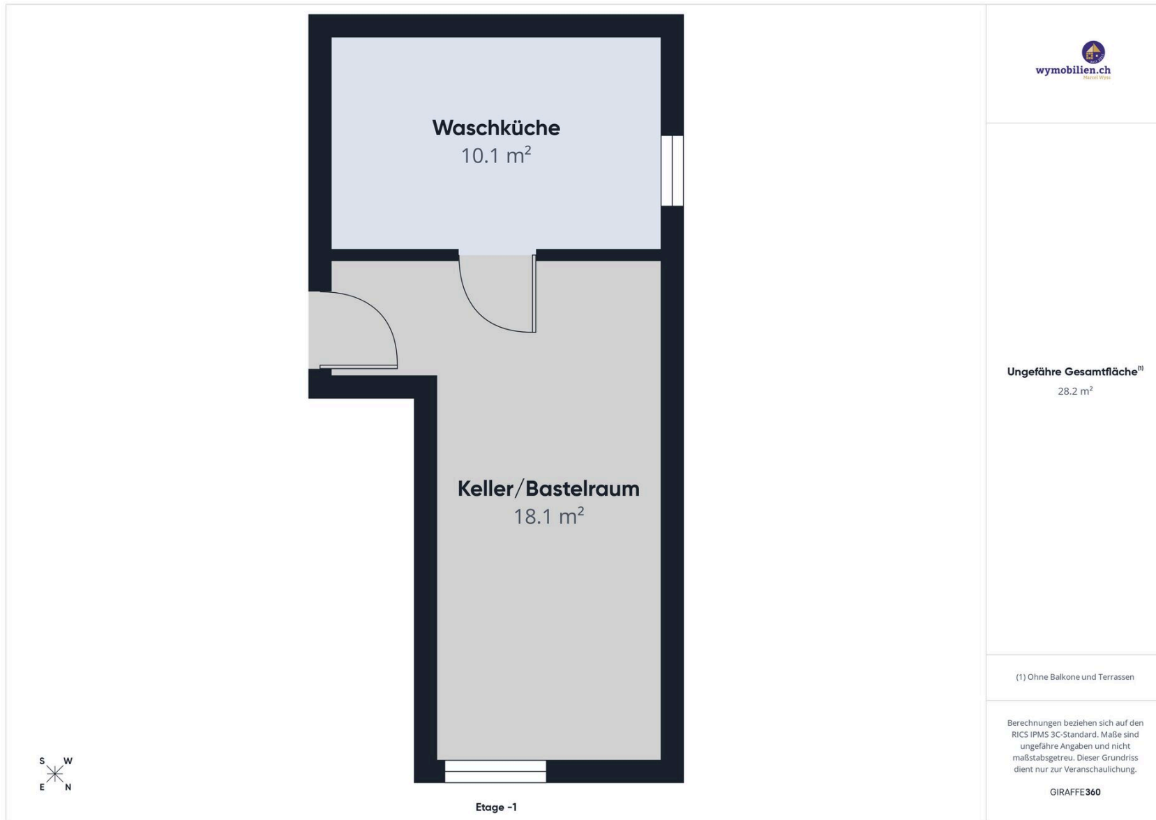
Grundriss UG mit den beiden priv. Räumen