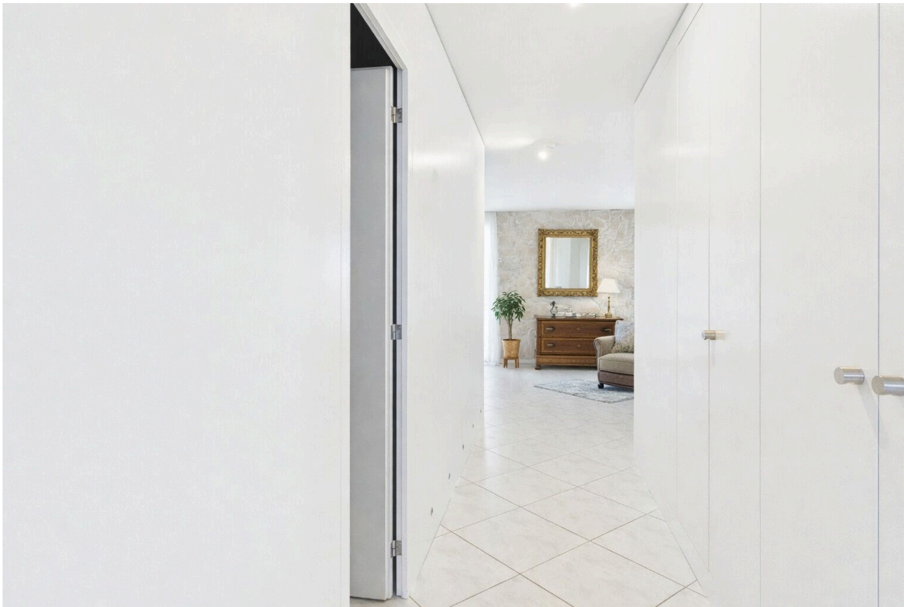
Korridor mit Wandschränken