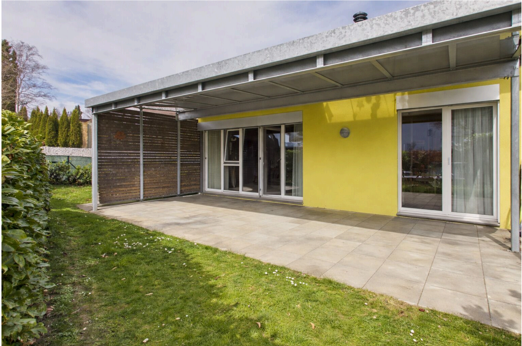
Die grosse, gedeckte Terrasse