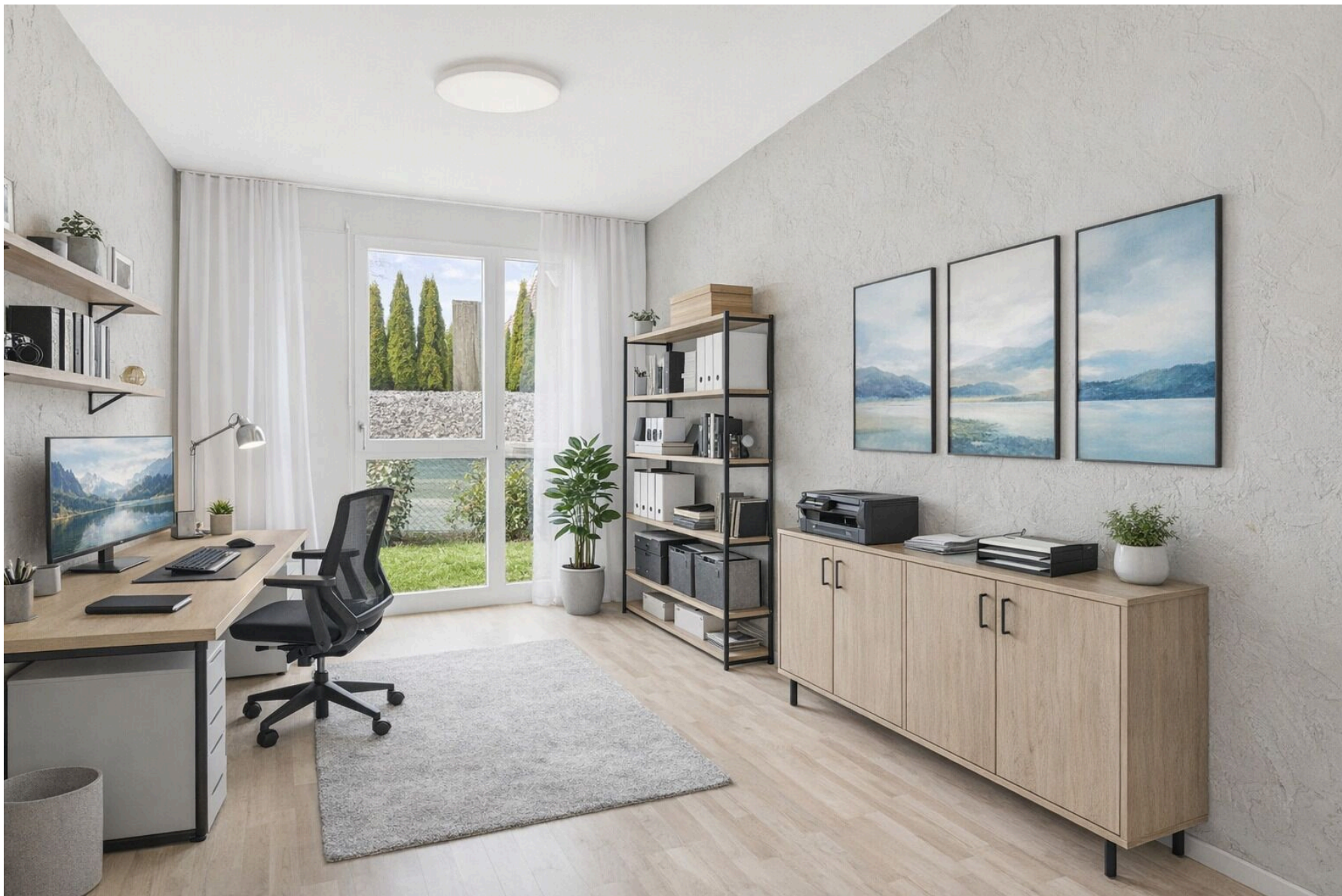
Zimmer 2 mit Möblierungsbeispiel