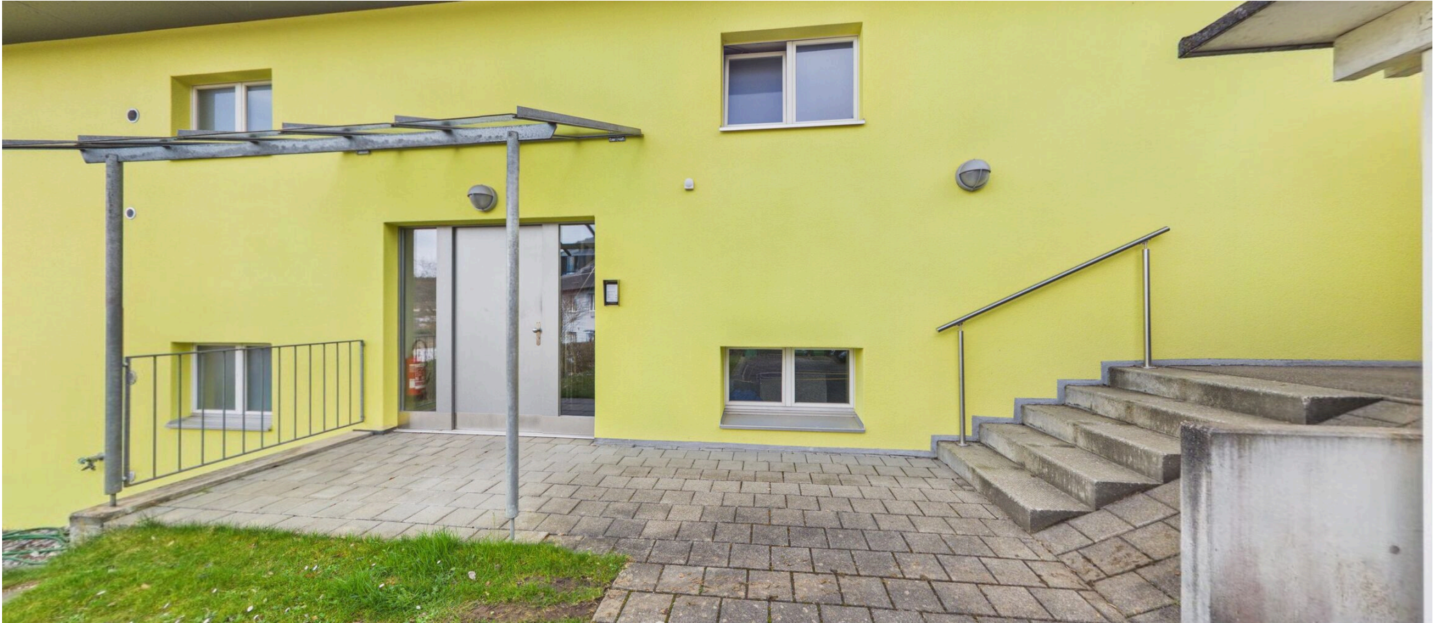
Eingangsbereich mit Carports (Nord)