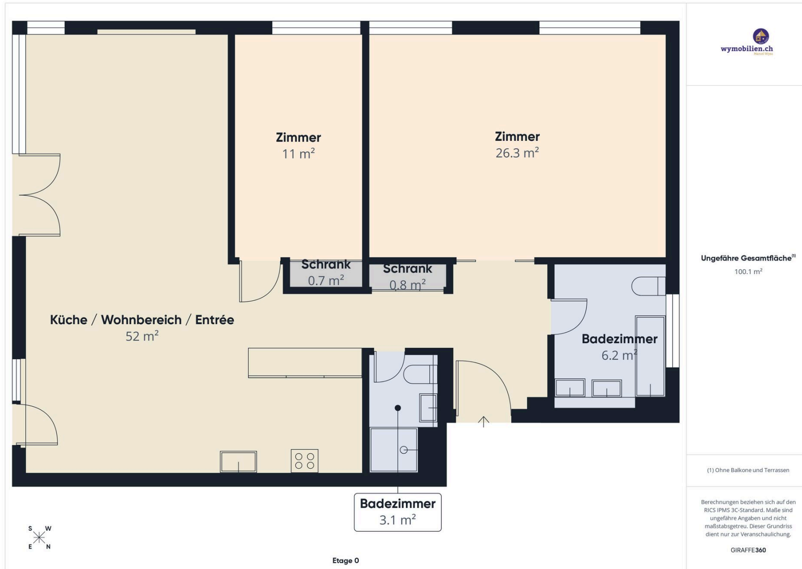
Grundriss der Wohnung