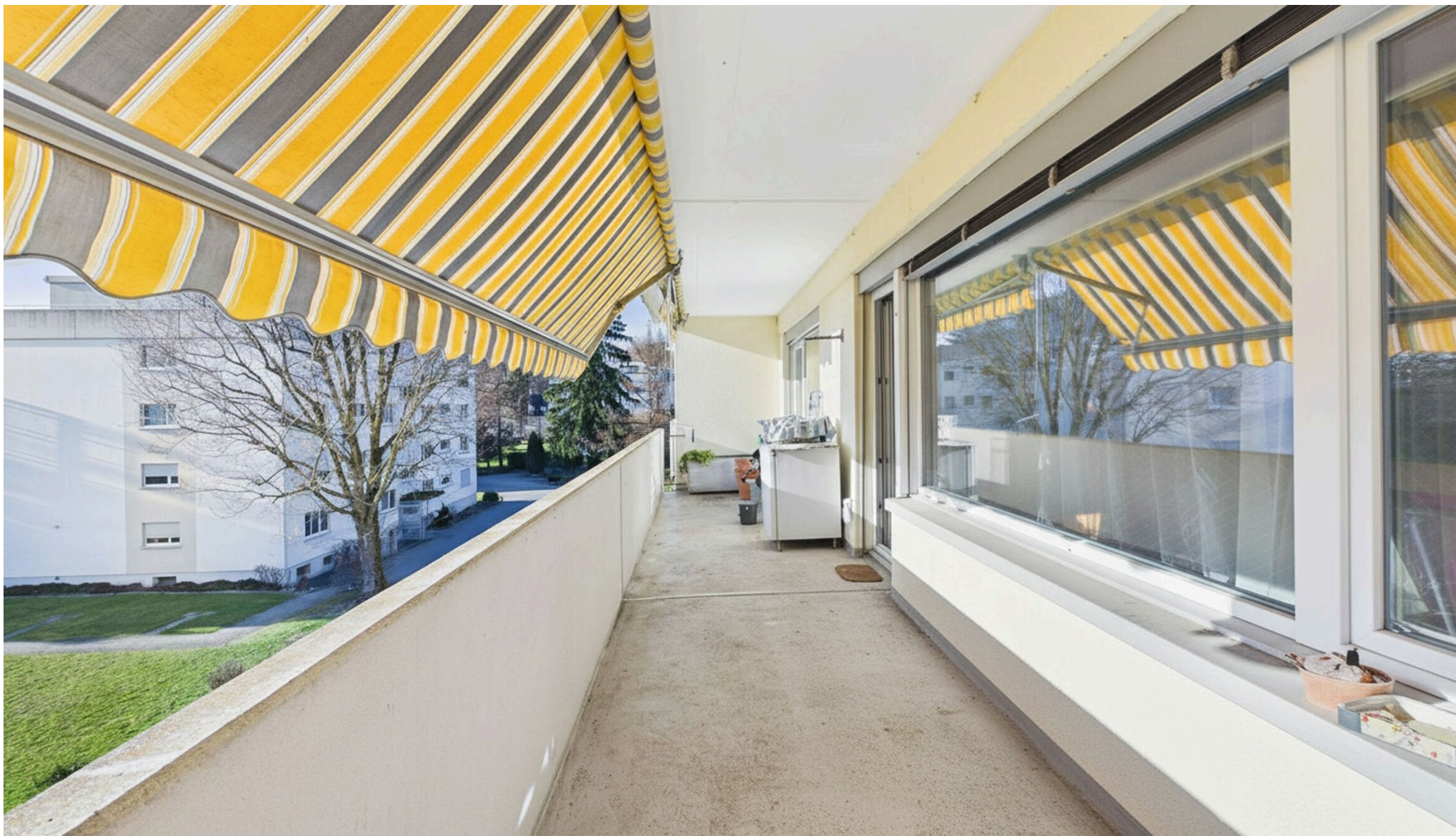
Grosser, sonniger Balkon