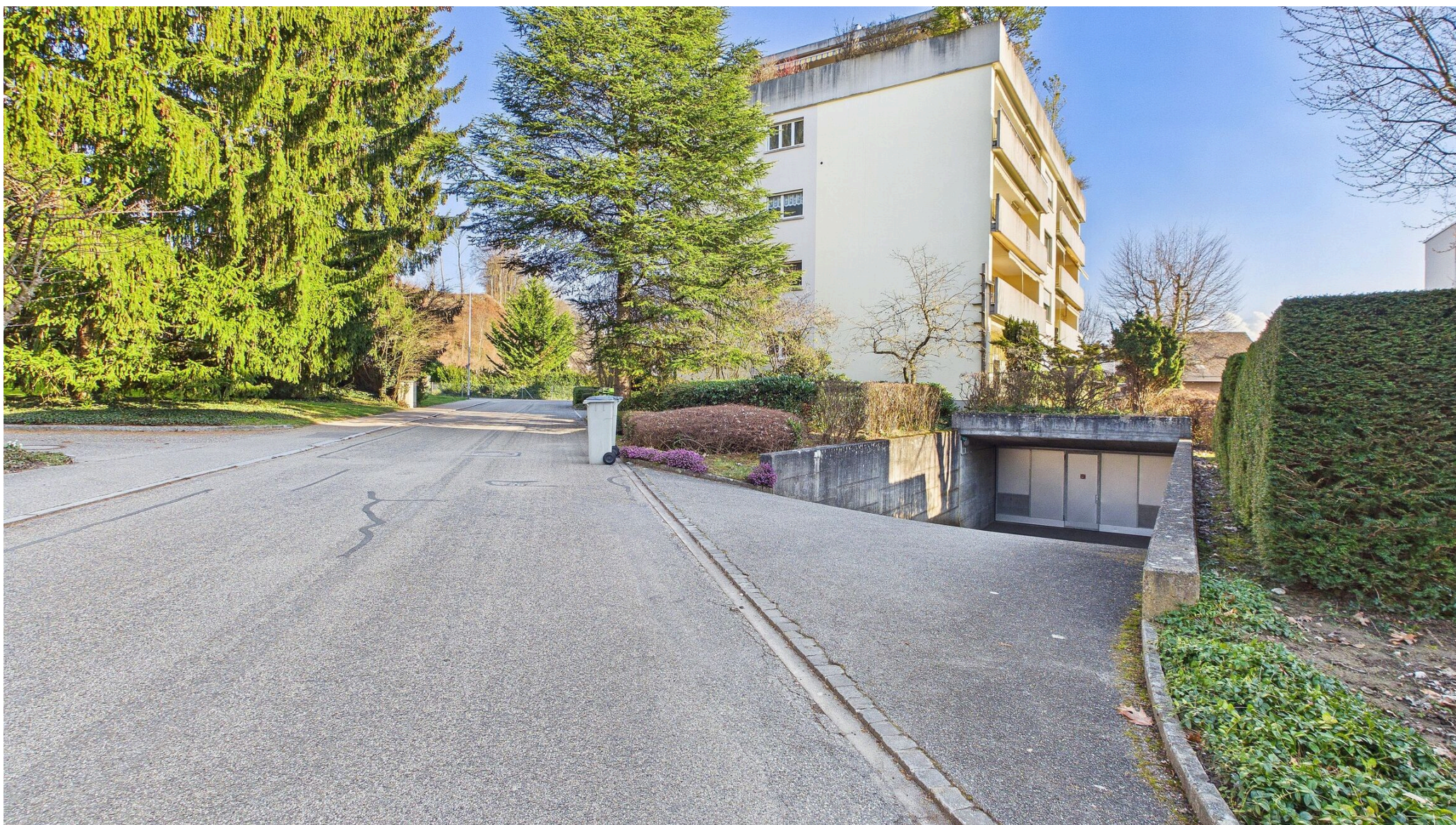
Zufahrt in die Einstellhalle