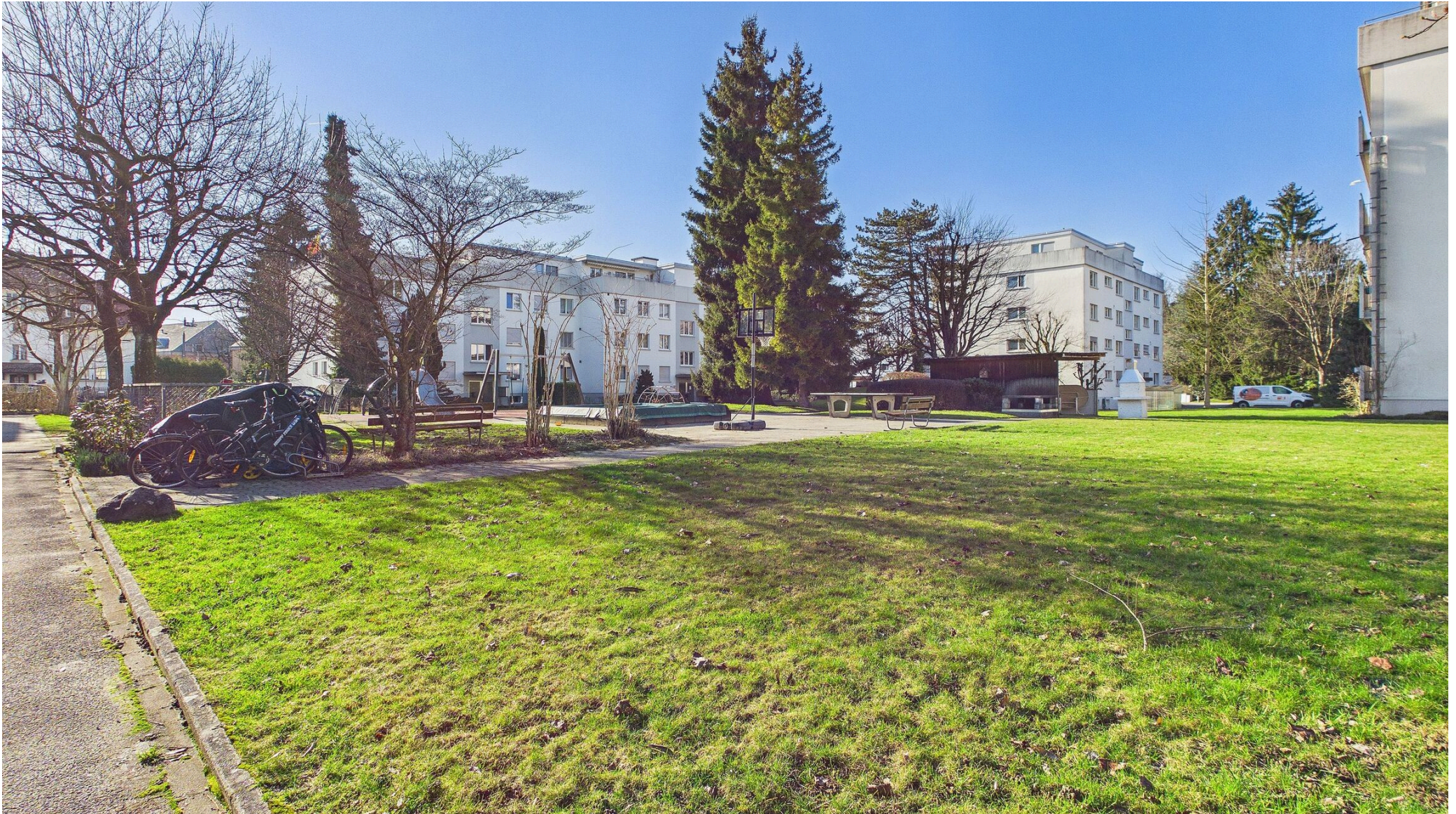
Grosse Grünfläche/Allgemeinfläche vor dem MFH