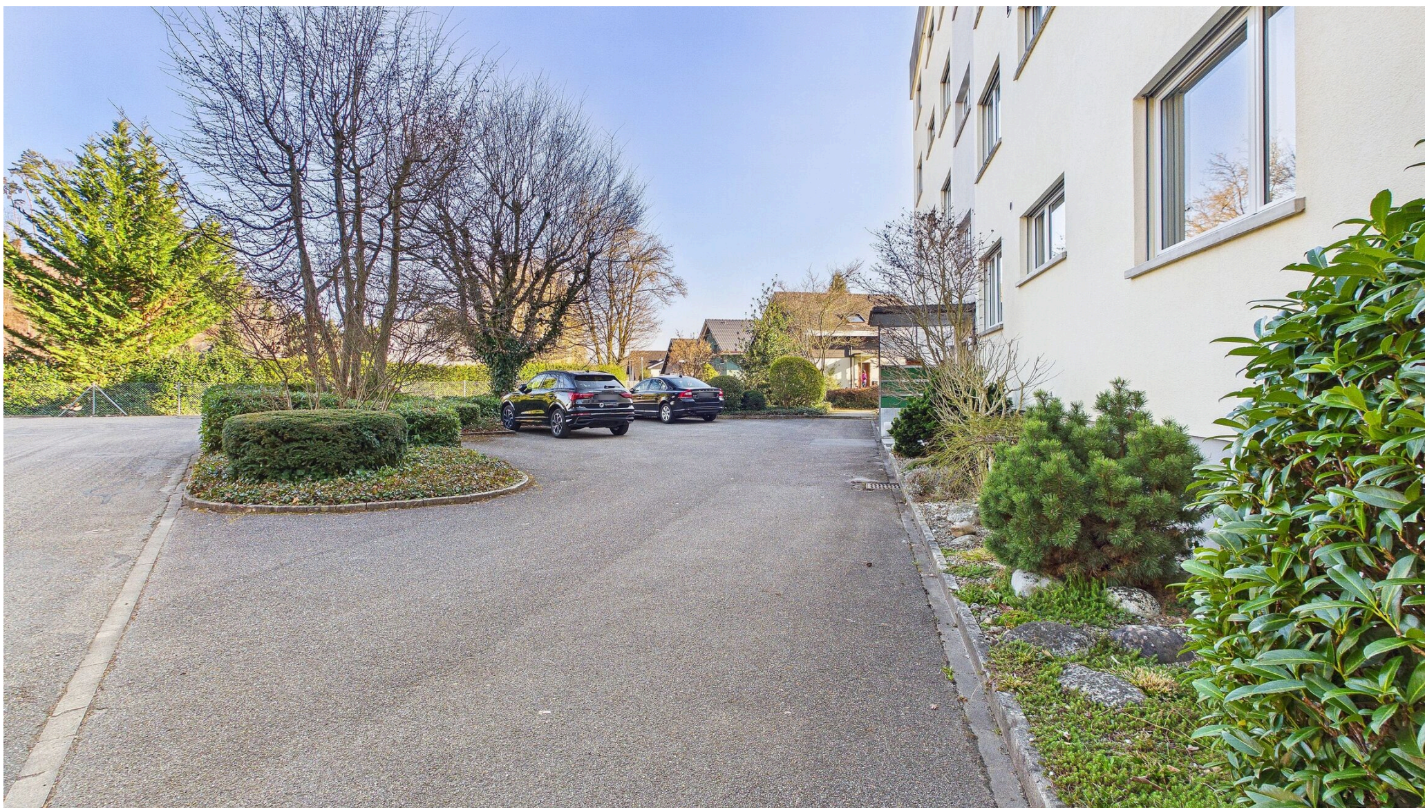
Vorplatz mit Besucherparkplätzen