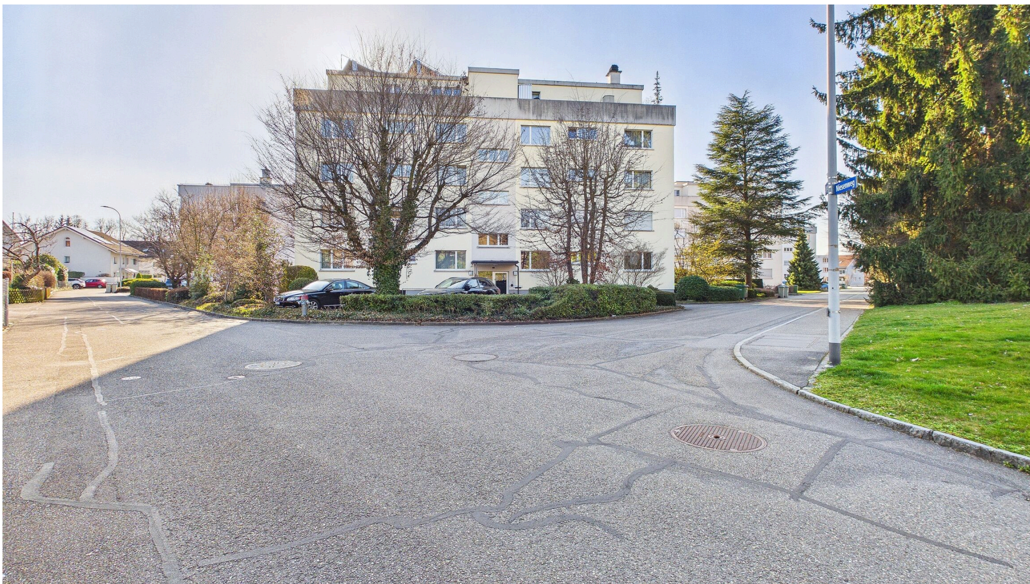
Ansicht MFH Eigerweg 8 (Nordost)