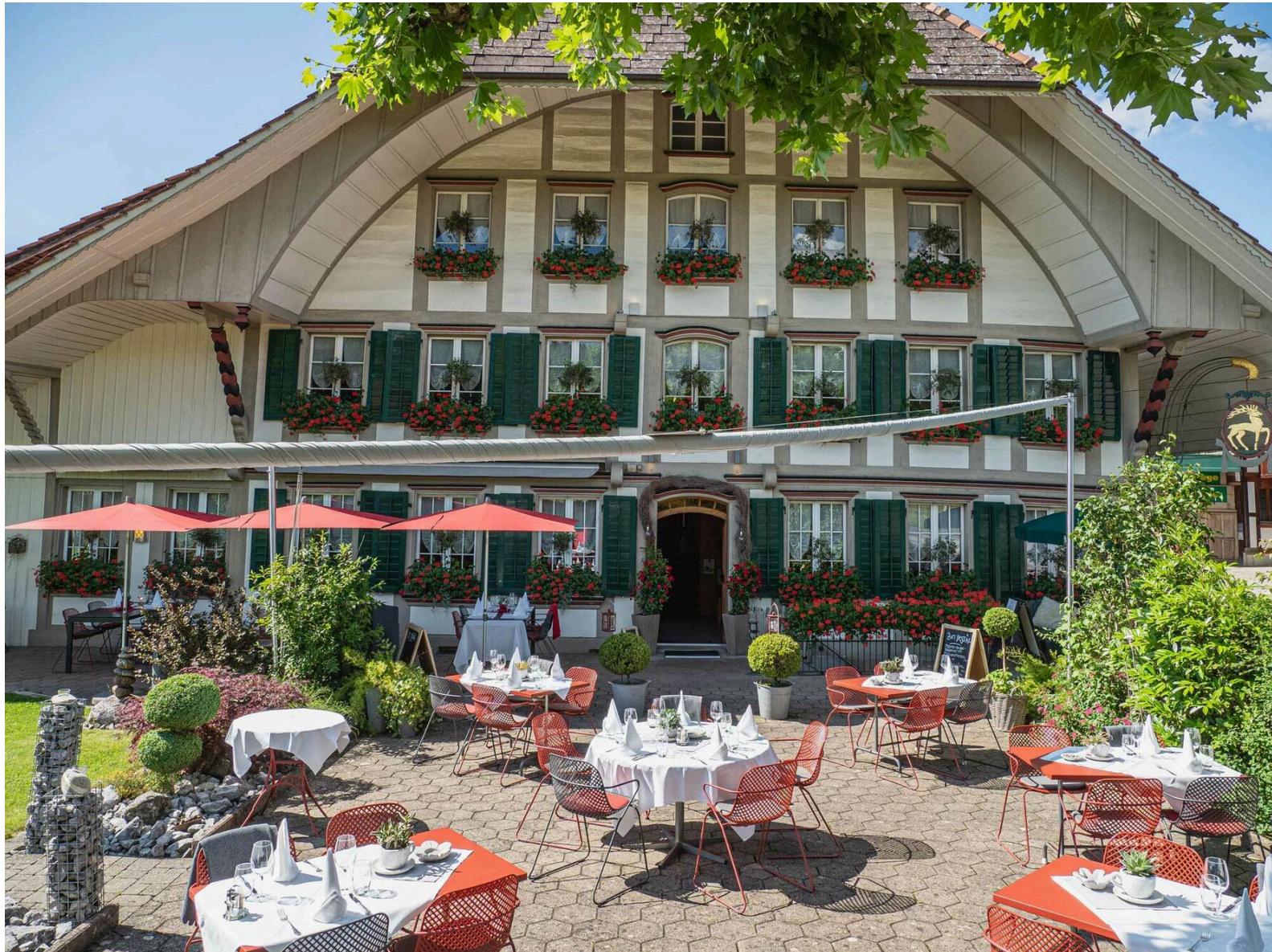
Die herrliche Terrasse