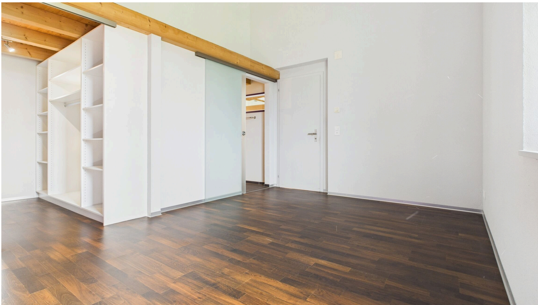
Zimmer mit Bad und Ankleide