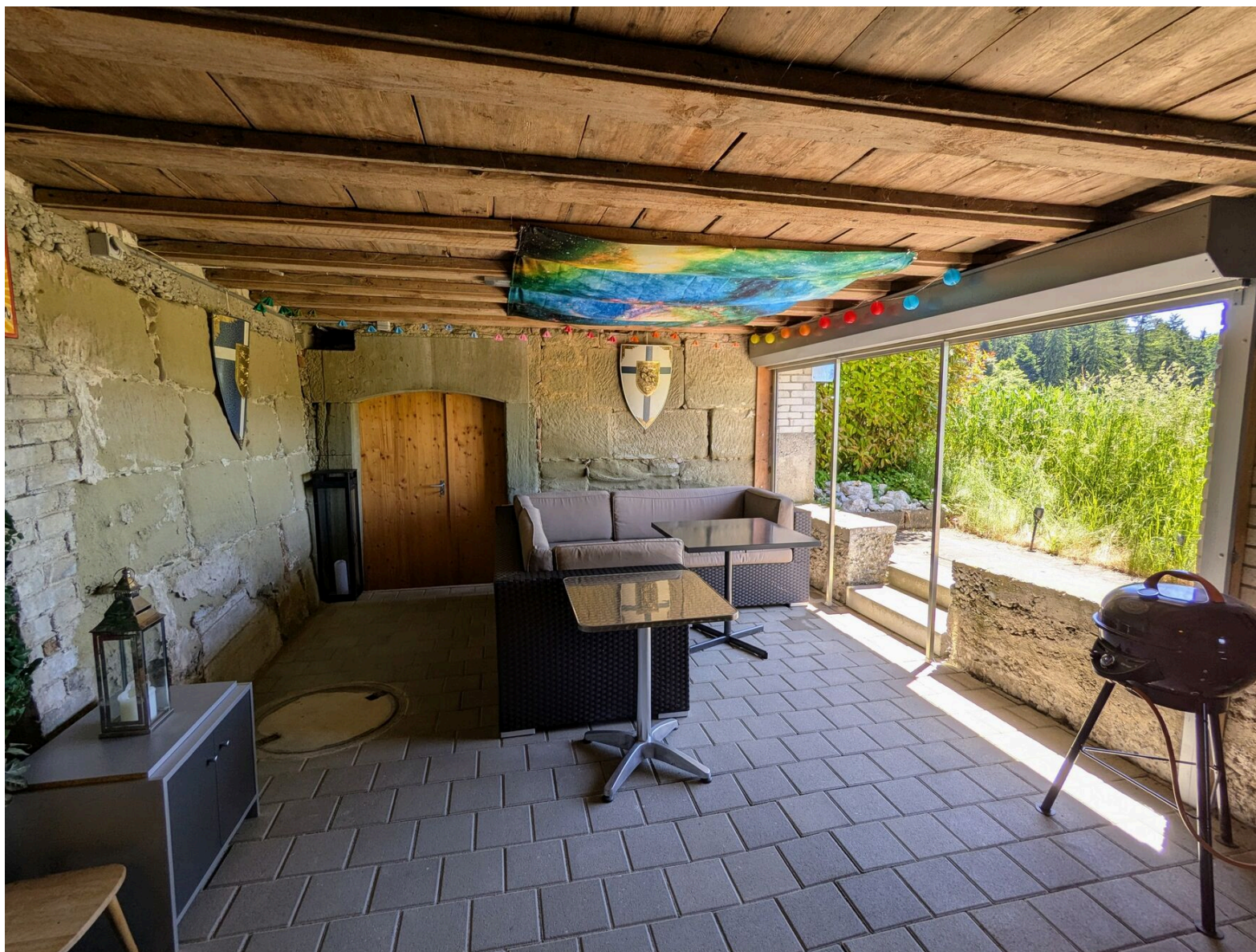
Loggia EG der Saalwohnung