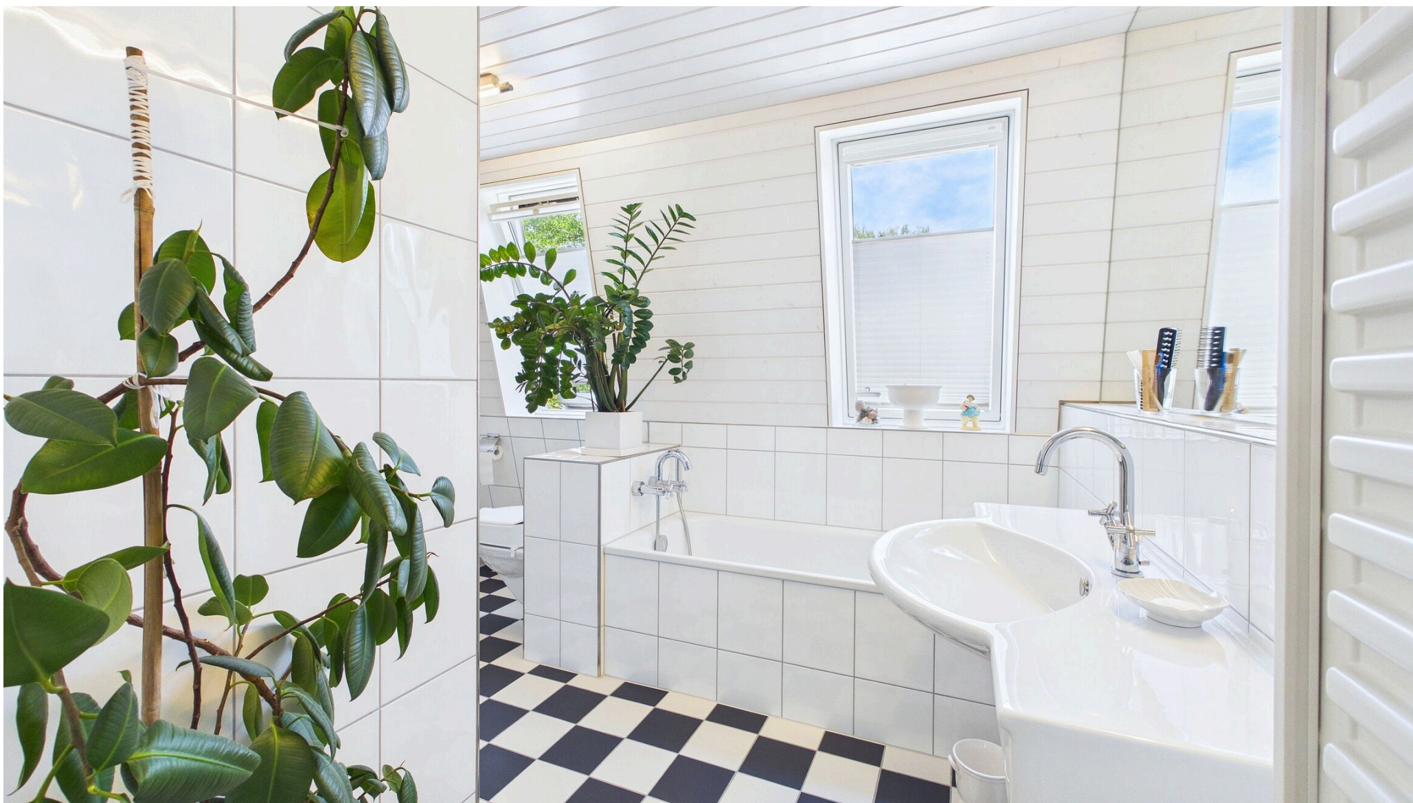
Bad mit Badewanne und Dusche