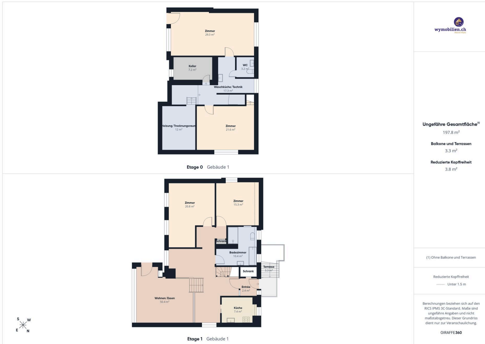
Grundriss der 2 Geschosse